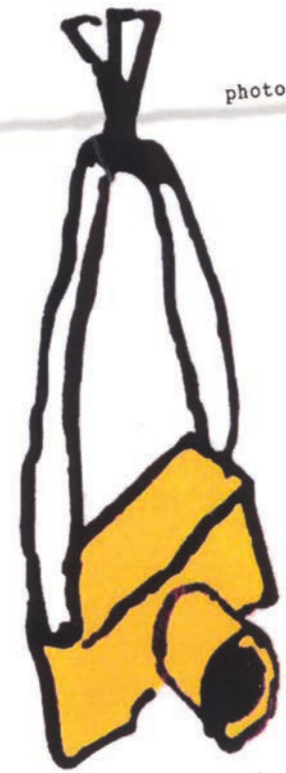
photo-look présente ...