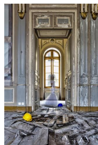
Eric MONVOISIN Les fantômes de la Mairie

Construit en 1919 par Roger Gonthier, architecte de la gare des Bénédictins, ce bâtiment a servi de pavillon frigorifique, puis de gare routière, avant d'être restauré par la mairie de Limoges pour devenir un lieu d'expositions en 1978.