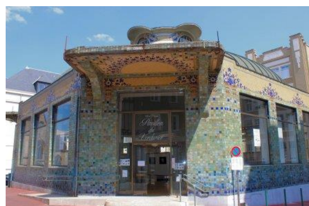
Le Pavillon du Verdurier

Sur l'île de La Réunion, dans l'Océan Indien, c'est un sentier qui nous plonge dans une ambiance magique, quasi surnaturelle.