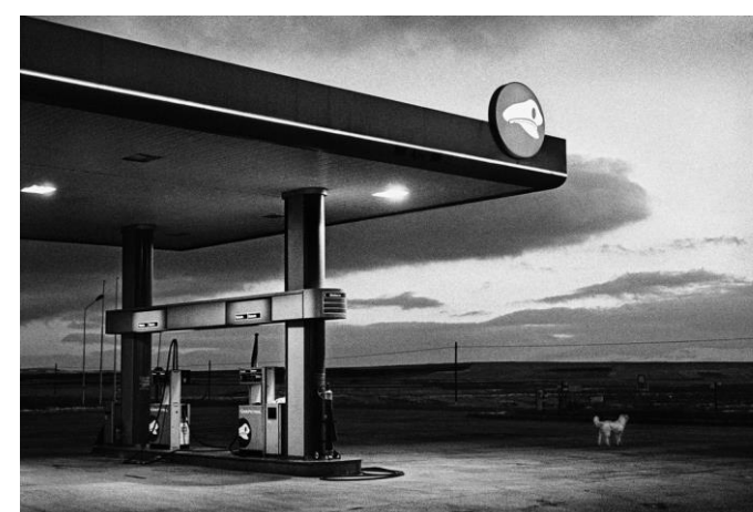
Romann RAMSHORN Lueurs cendrées

Les photographies présentées ont été réalisées en février 2020 et en juillet 2022 dans la Mairie d'Annecy, ravagée par un incendie en novembre 2019. Il m'a semblé plus original et plus onirique de faire apparaître les personnages essentiellement en transparence pour apporter à ces lieux dévastés une touche de poésie.