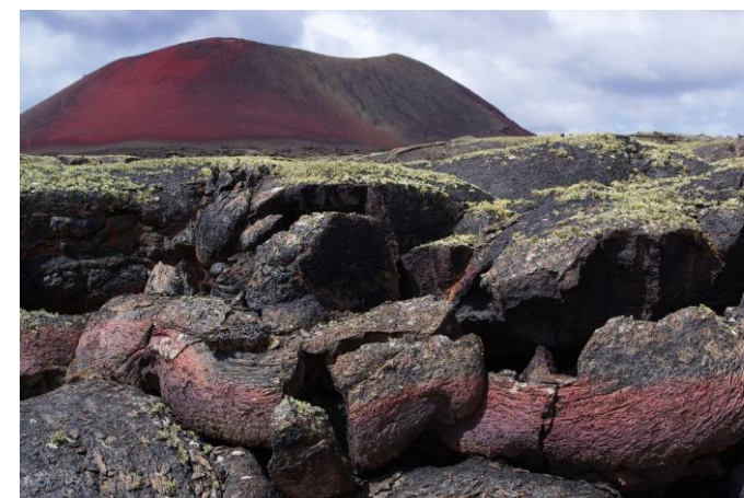
Valérie GASTINE Extra_Terrestre

Cette nature sublime fait vibrer les architectures admirées lors des mes voyages photographiques.